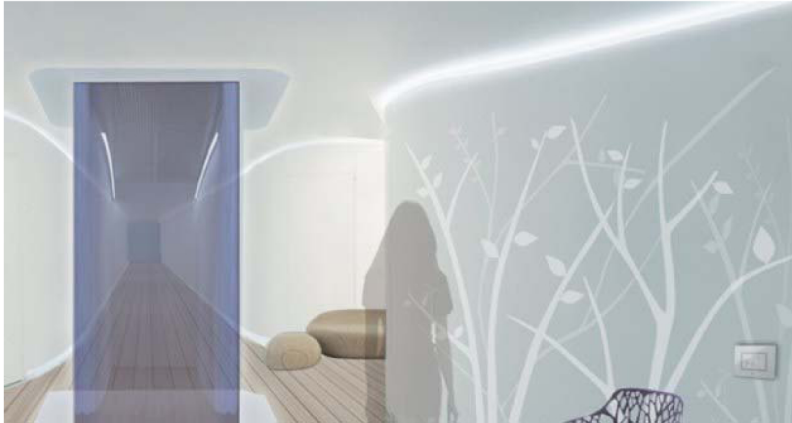
Από τη Νατάσα Γιαννούση

Επαναστατικές τεχνολογίες, διαδραστικό παιχνίδι αισθήσεων, προηγμένες λύσεις που μεταφέρουν το μέλλον της φιλο